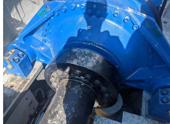
Anillo de acoplamiento