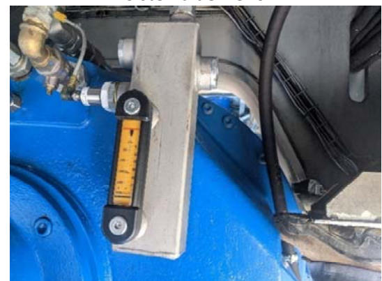
Visor temperatura aceite