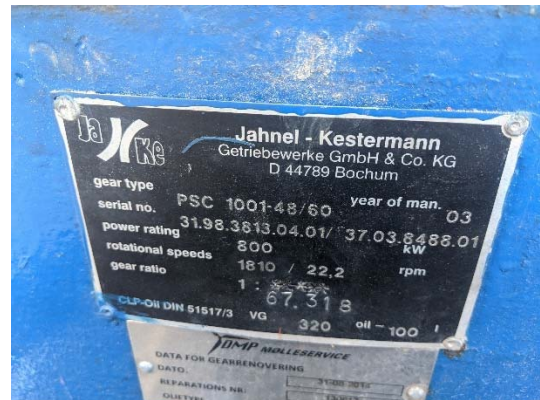
Placa de características