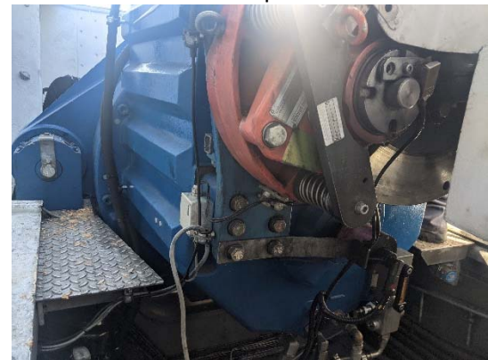
Sistema de freno